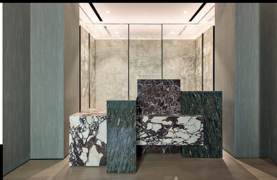
Большая часть мебели создана по проектам дизайнеров Fendi Casa