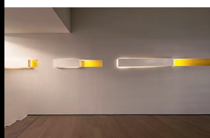
Светильники в коридорах будто вдохновлены работами скульптора-минималиста Дональда Джадда