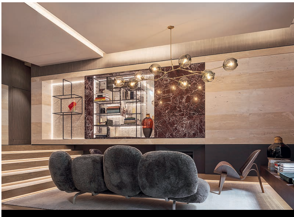
Лобби отеля скорее напоминает уютную квартиру