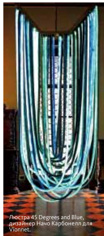
Люстра 45 Degrees and Blue, дизайнер Начо Карбонелл для Vionnet.