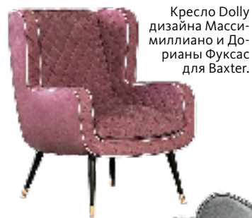
Кресло Dolly дизайна Массимилиано и Дорианы Фуксас для Baxter.

Американцы называют их креслами с ушами, англичане — креслами с крыльями, французы — вольтерровскими. Но важно другое — сейчас это самый популярный тип кресел у любых производителей — от «классиков» до «новаторов».