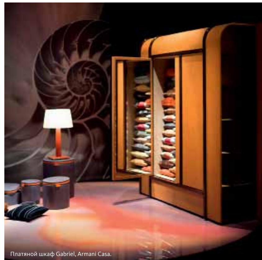
Платяной шкаф Gabriel, Armani Casa.

После довольно долгого перерыва презентация новой коллекции Armani Casa вновь прошла в Armani Teatro — лаконичном, почти скульптурном бетонном сооружении, где мебель и предметы декора были выставлены в полумраке, как картины в некоторых музеях. В отличие от серо-бежевой гаммы предыдущих лет в этом году коллекция расцвела нежно-голубым и кораллово-красным. К цветам добавилась зернистый рисунок древесины японского ясеня тамо — именно из него сделан шкаф Gabriel, своей конструкцией и отделкой из полосок коричневой кожи явно отсылающий нас к винтажным дорожным сундукам.