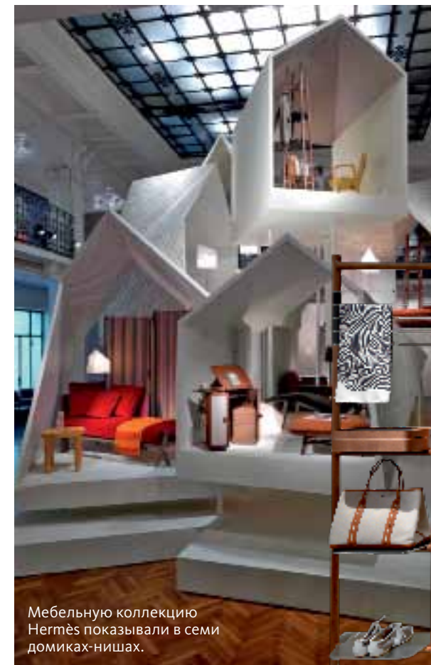
Мебельную коллекцию Hermès показывали в семи домиках-нишах.