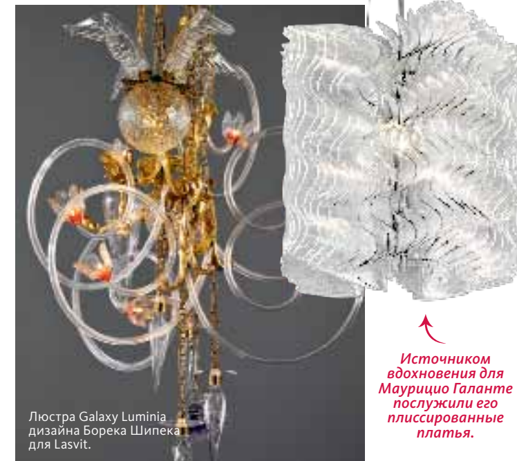
Источником вдохновения для Маурицио Галанте послужили его плиссированные платья.

Богемский хрусталь стоит в нашей табели о рангах ниже французского, а зря. Взять хотя бы чешскую мануфактуру Lasvit, представившую в Милане произведения работающих с ней именитых дизайнеров: охпку цветных бутылок Арика Леви, холм из светящихся шариков от Росса Лавгрова, облако из матовых конусов Майкла Янга, плиссированные люстру и ширму Маурицио Галанте. Но самые интересные объекты были у Борека Шипека — гроздь фантастических цветов, шаров и колокольчиков.