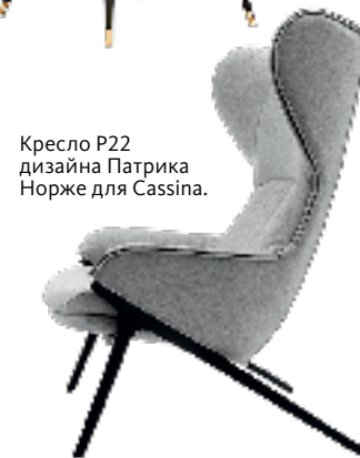
Кресло P22 дизайна Патрика Норже для Cassina.