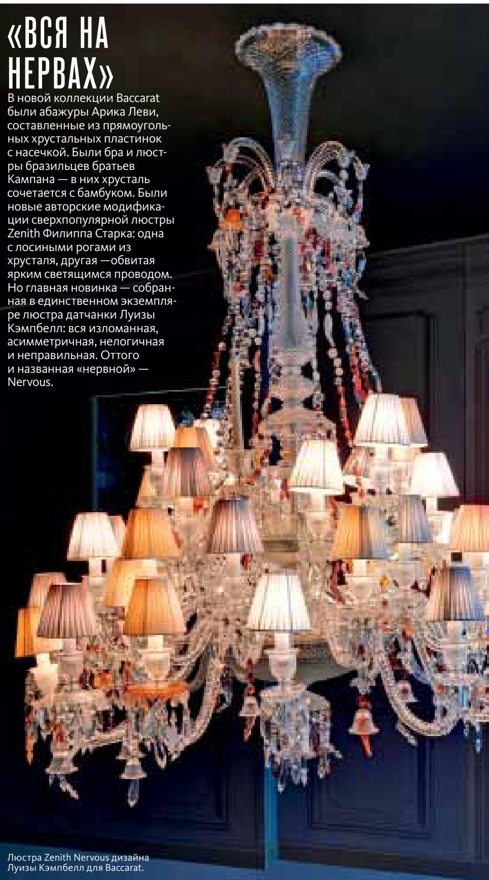
Люстра Zenith Nervous дизайна Луизы Кэмпбелл для Vassarat.

В новой коллекции Vassarat были абажуры Арика Леви, составленные из прямоугольных хрустальных пластинок с насечкой. Были бра и люстры бразильцев братьев Кампана — в них хрусталь сочетается с бамбуком. Были новые авторские модификации сверхпопулярной люстры Zenith Филиппа Старка: одна с лосиными рогами из хрусталя, другая — обвитая ярким светящимся проводом. Но главная новинка — собранная в единственном экземпляре люстра датчанки Луизы Кэмпбелл: вся изломанная, асимметричная, нелогичная и неправильная. Оттого и названная «нервной» — Nervous.