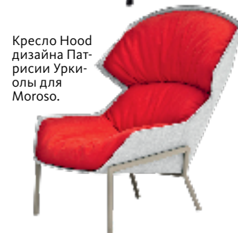
Кресло Hood дизайна Патрисии Уркиолы для Moroso.