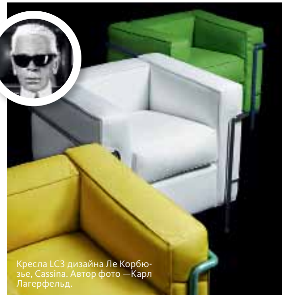
Кресла LC3 дизайна Ле Корбюзье, Cassina.