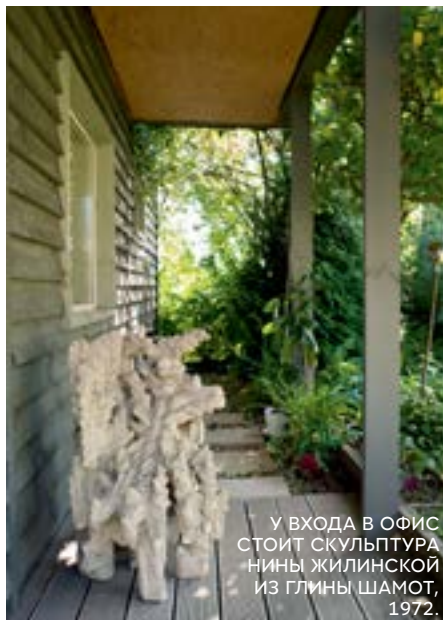
У ВХОДА В ОФИС СТОИТ СКУЛЬПТУРА НИНЫ ЖИЛИНСКОЙ ИЗ ГЛИНЫ ШАМОТ, 1972.