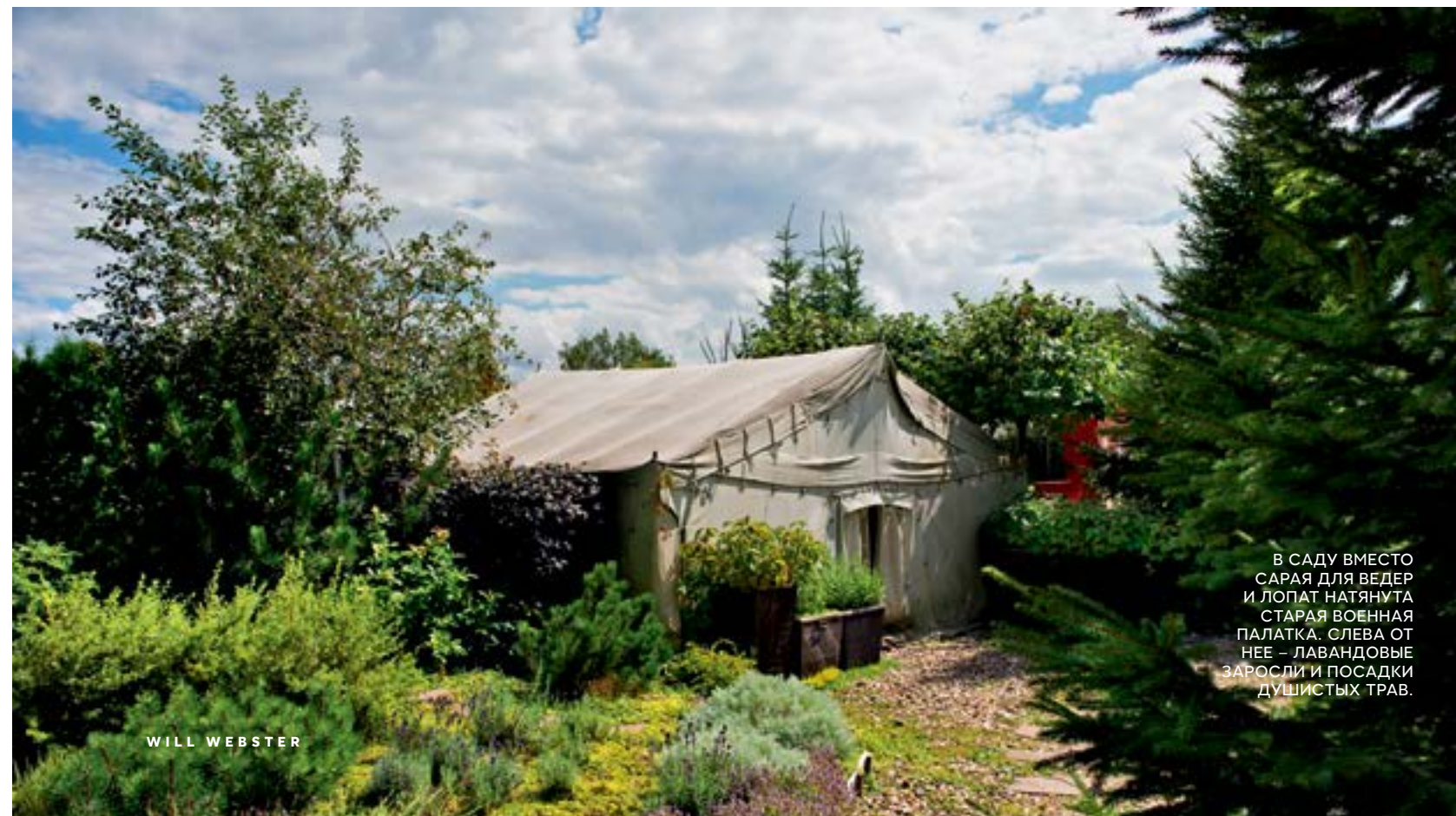
В САДУ ВМЕСТО САРАЯ ДЛЯ ВЕДЕР И ЛОПАТ НАТЯНУТА СТАРАЯ ВОЕННАЯ ПАЛАТКА. СЛЕВА ОТ НЕЕ — ЛАВАНДОВЫЕ ЗАРОСЛИ И ПОСАДКИ ДУШИСТЫХ ТРАВ.

«Гипсовой девушкой с веслом никого не удивишь, а вот красный человек ростом с дом и еще один, маленький, сидящий на крыше, — это производит впечатление».