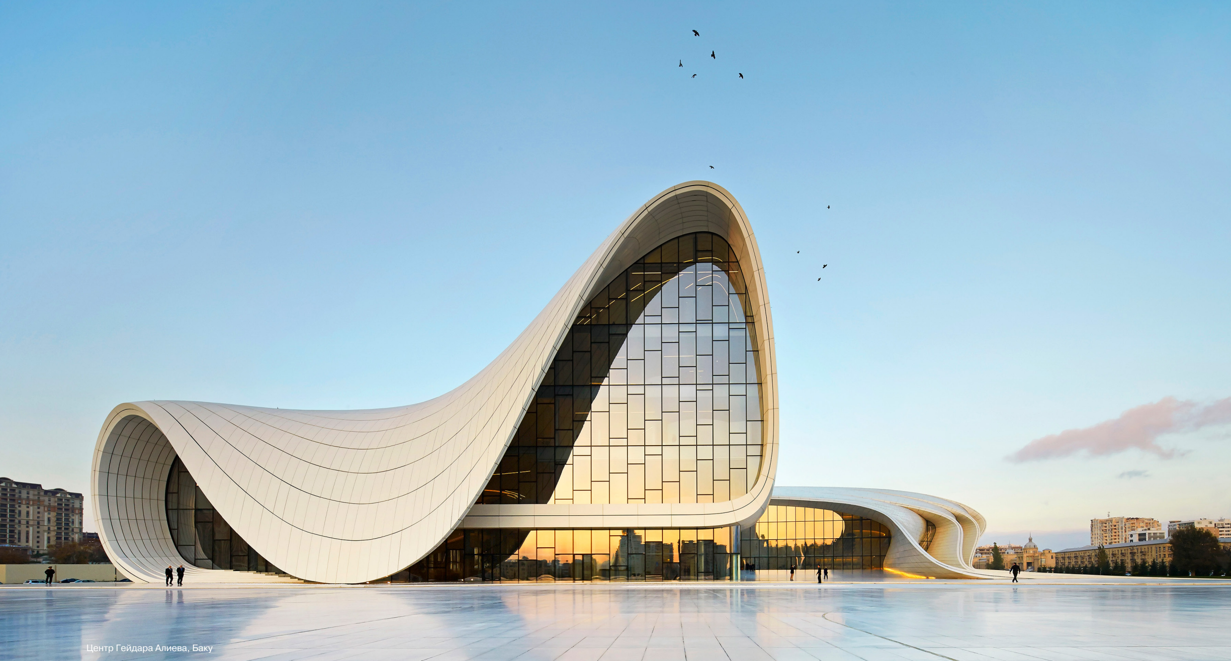
Центр Гейдара Алиева, Баку