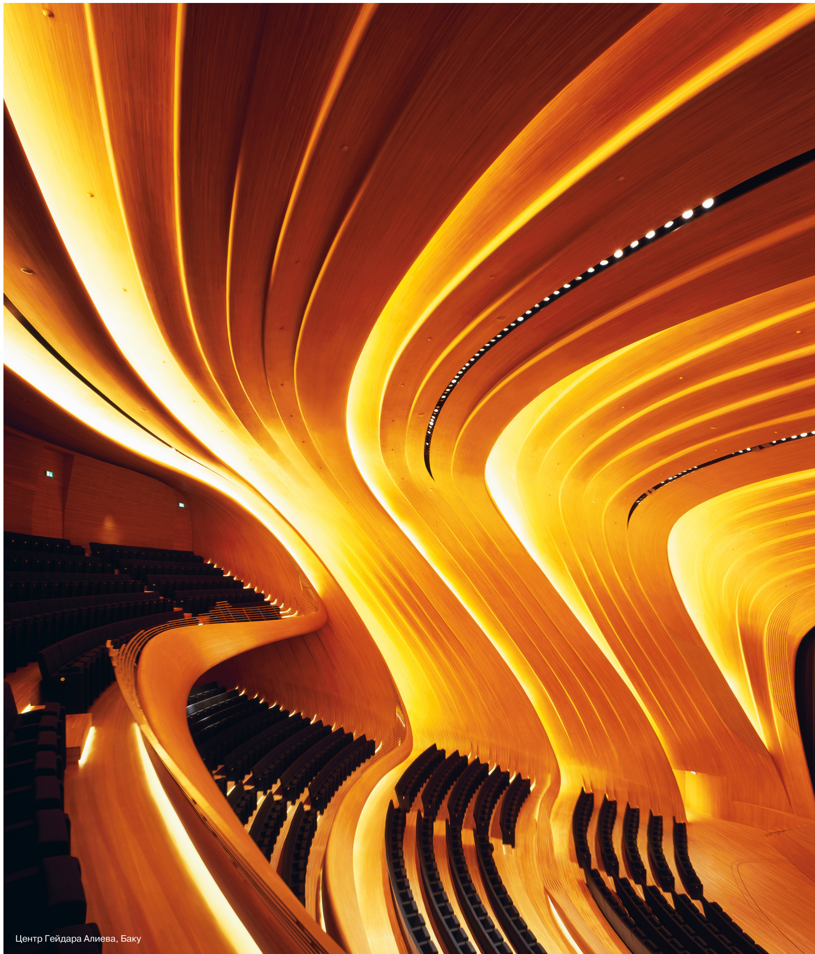
Центр Гейдара Алиева, Баку