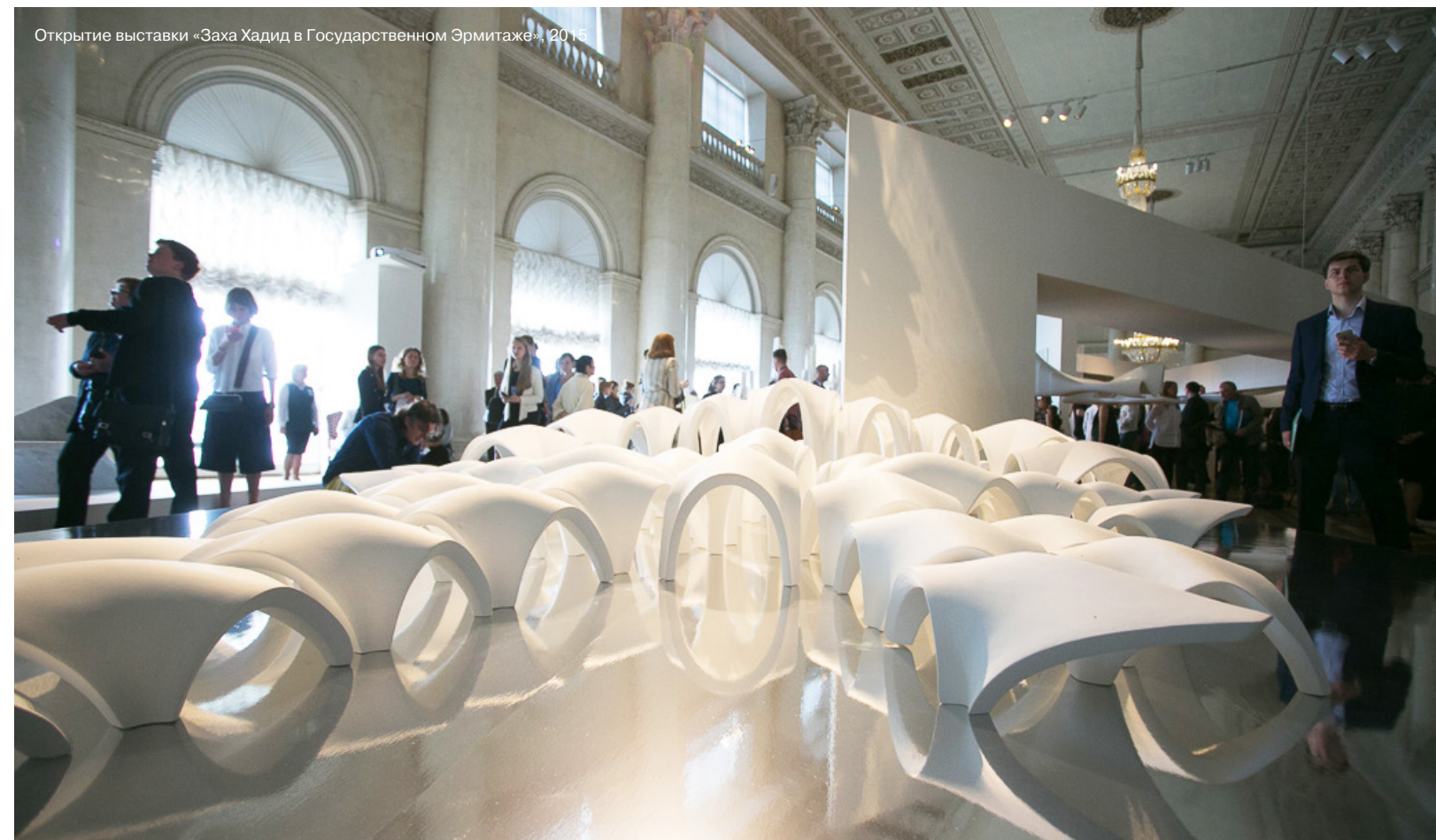
Открытие выставки «Заха Хадид в Государственном Эрмитаже», 2015