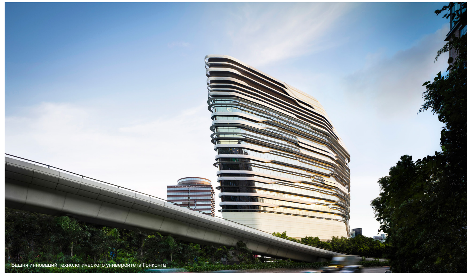
Башня инноваций технологического университета Гонконга

Ее часто спрашивают, каково это — быть архитектором-женщиной. «Я думаю, это показывает, что на самом деле пройти сквозь стеклянный потолок — возможно». И добавляет, что она счастлива видеть, как ее успех помогает другим женщинам поверить в то, что такие высоты достижимы. Она действительно потрясающий пример, не только для женщин. Ее характер, идеи всегда вели ее против течения, и даже невыигранные на первый взгляд обстоятельства рождения и особенности профессии она обратила себе на пользу. И теперь она стоит на самой вершине — свободная женщина Востока, сумевшая сделать то, что не удалось многим мужчинам: изменить мир. 🇷🇺