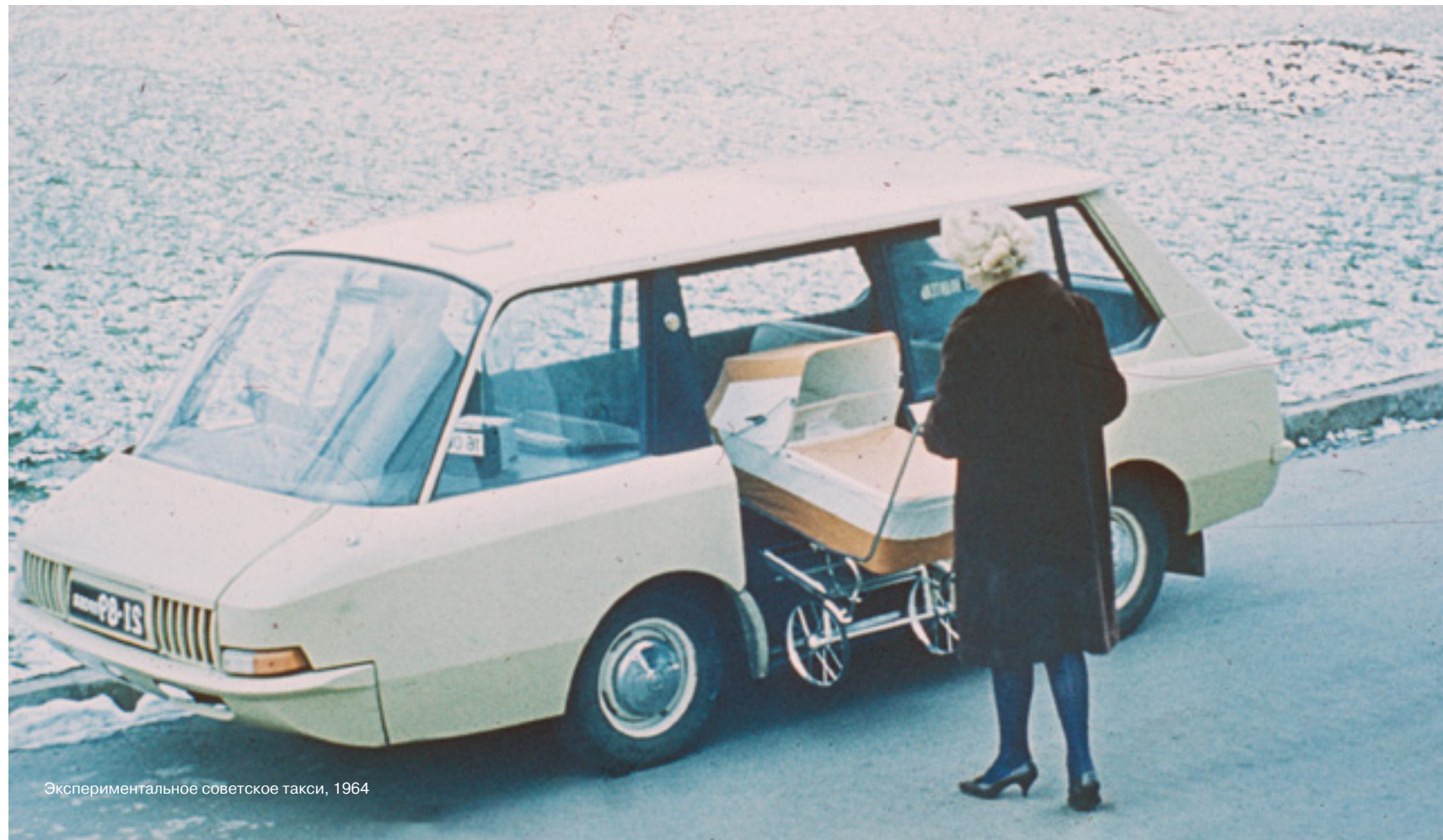
Экспериментальное советское такси, 1964