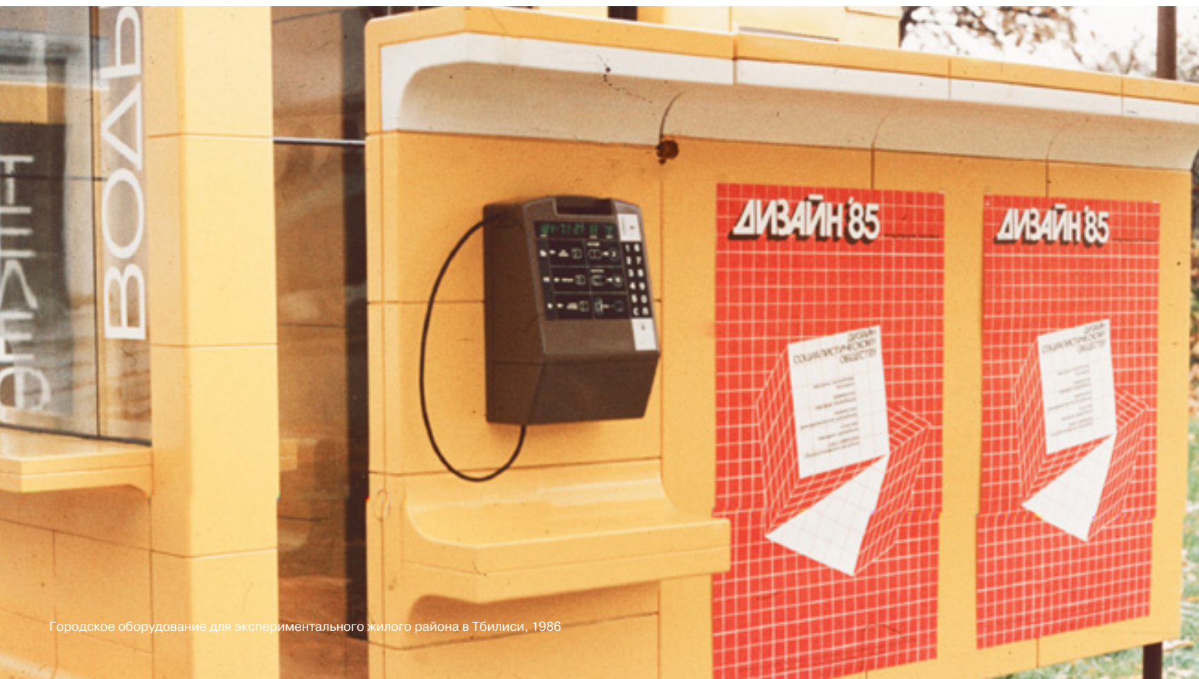
Городское оборудование для экспериментального жилого района в Тбилиси, 1986