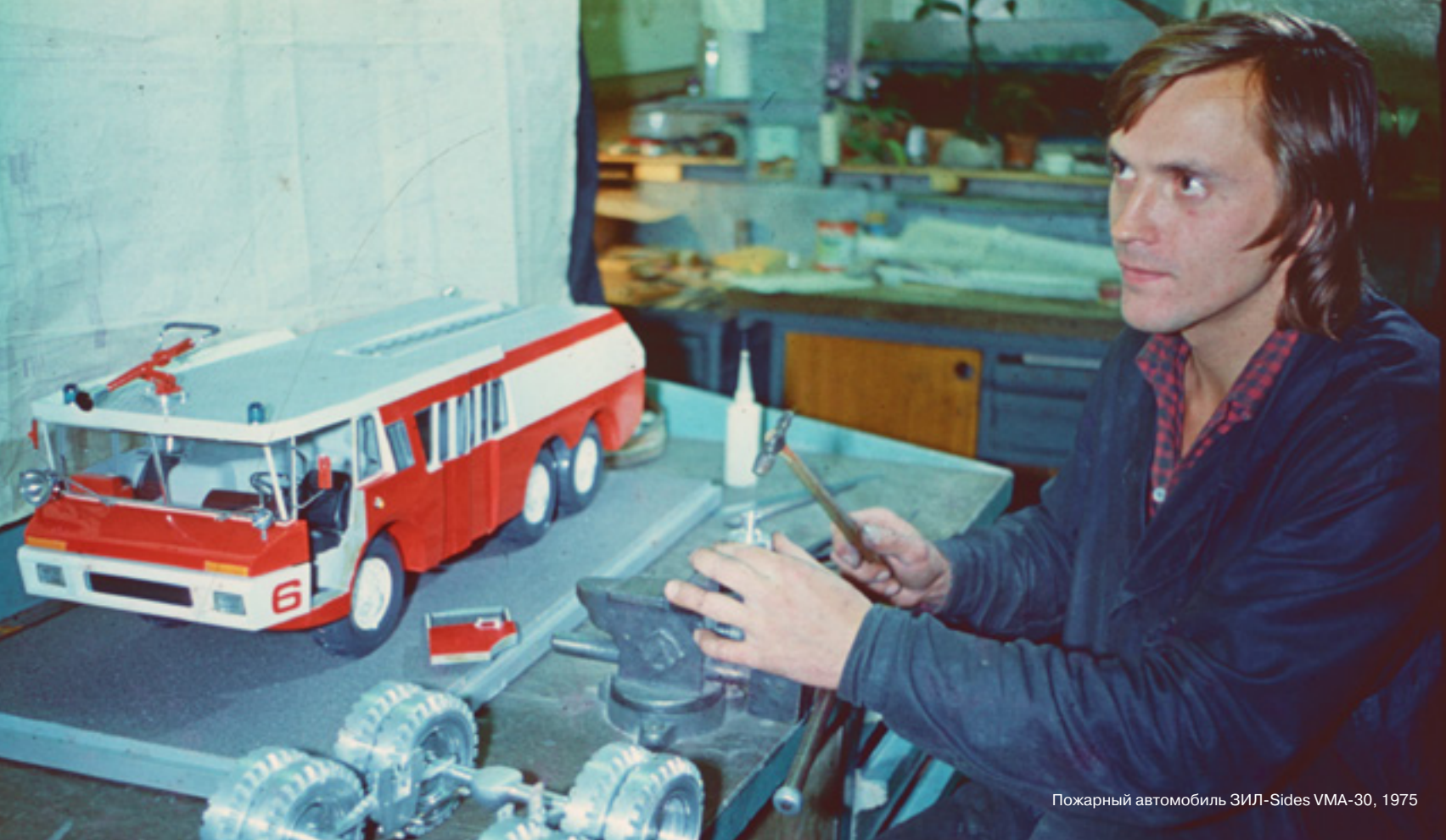
Пожарный автомобиль ЗИЛ-Sides VMA-30, 1975