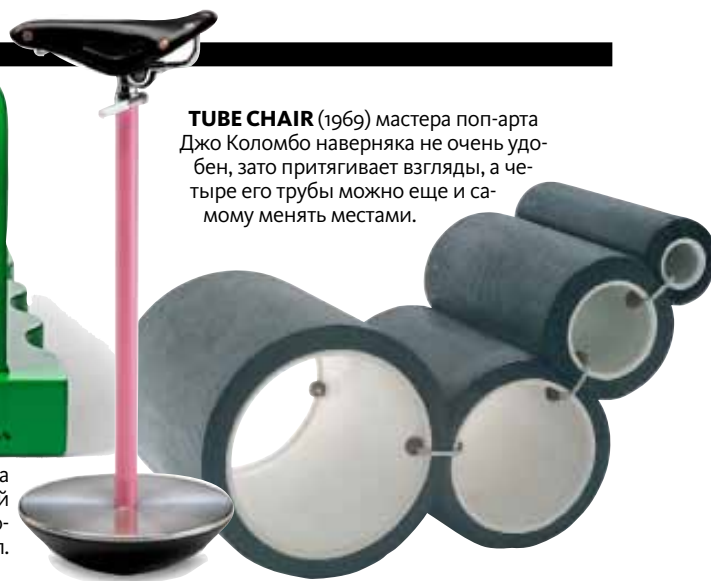
TUBE CHAIR (1969) мастера поп-арта Джо Коломбо наверняка не очень удобен, зато притягивает взгляды, а четыре его трубы можно еще и самому менять местами.