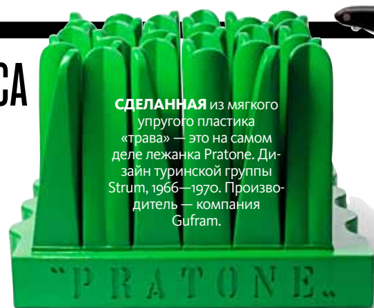
СДЕЛАННАЯ из мягкого упругого пластика «трава» — это на самом деле лежанка Pratone. Дизайн туринской группы Strum, 1966—1970. Производитель — компания Gufam.

Еще в 1960-е дизайнеры поняли, что нужно делать вещи не только «для нужды», но и «для души», как сформулировал знаменитый британец Теренс Конран. Функциональность отходит на задний план, а весь дизайн этого периода — сплошное веселье и чистое удовольствие: яркий пластик, круглые формы, оп-артовые рисунки, бумажная и надувная мебель.