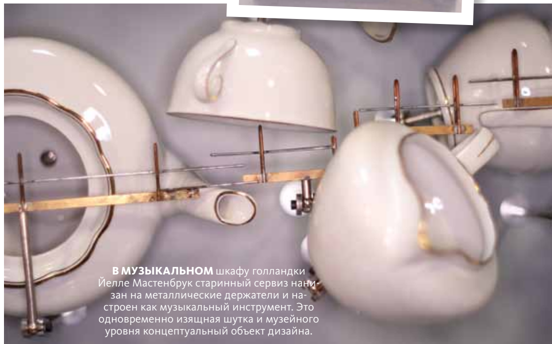
В МУЗЫКАЛЬНОМ шкафу голландки Йелле Мастенбрук старинный сервиз нацан на металлические держатели и настроен как музыкальный инструмент. Это одновременно изящная шутка и музейного уровня концептуальный объект дизайна.