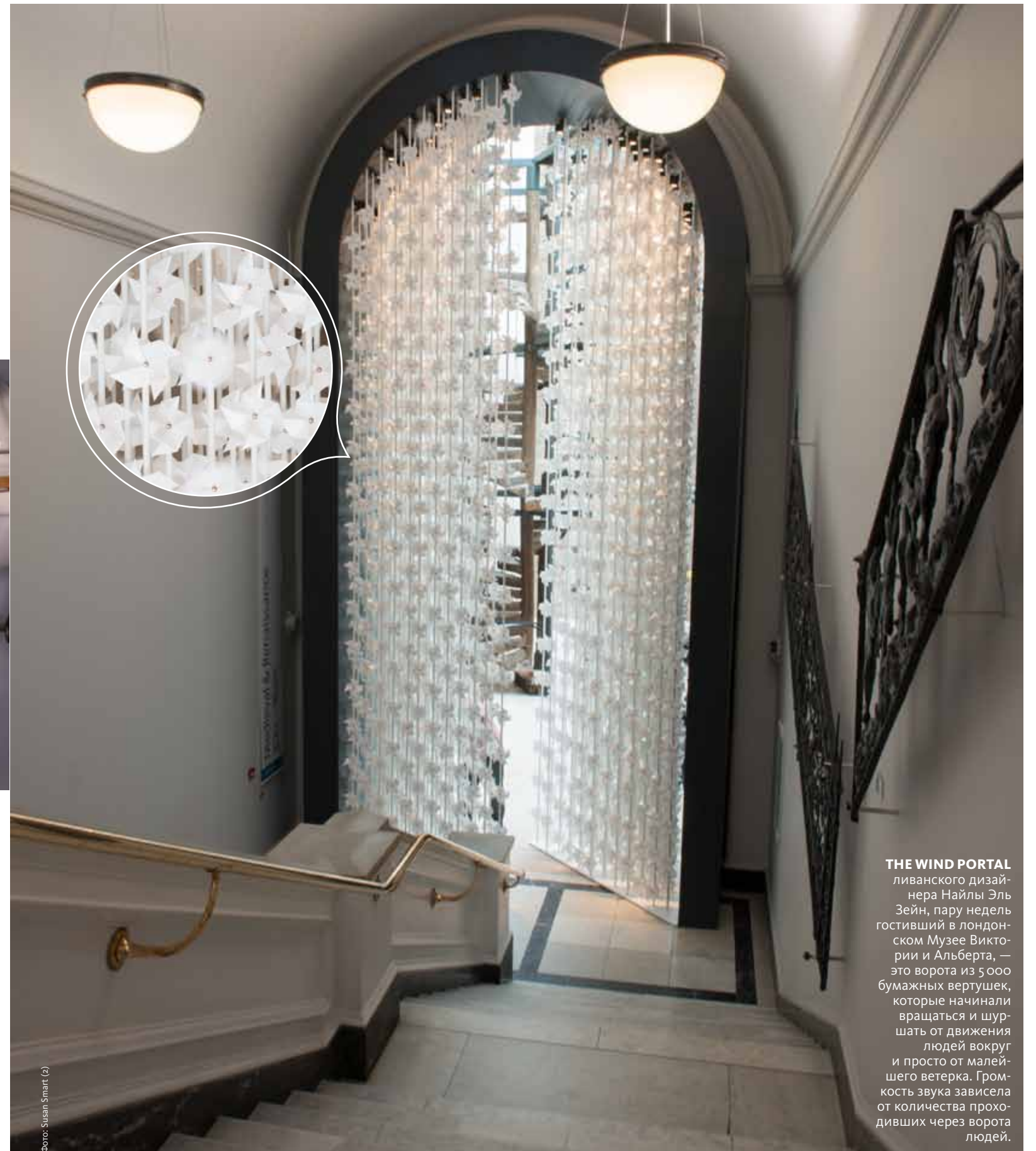
THE WIND PORTAL ливанского дизайнера Найлы Эль Зейн, пару недель гостивший в лондонском Музее Виктории и Альберта, — это ворота из 5 000 бумажных вертушек, которые начинали вращаться и шуршать от движения людей вокруг и просто от малейшего ветерка. Громкость звука зависела от количества проходивших через ворота людей.