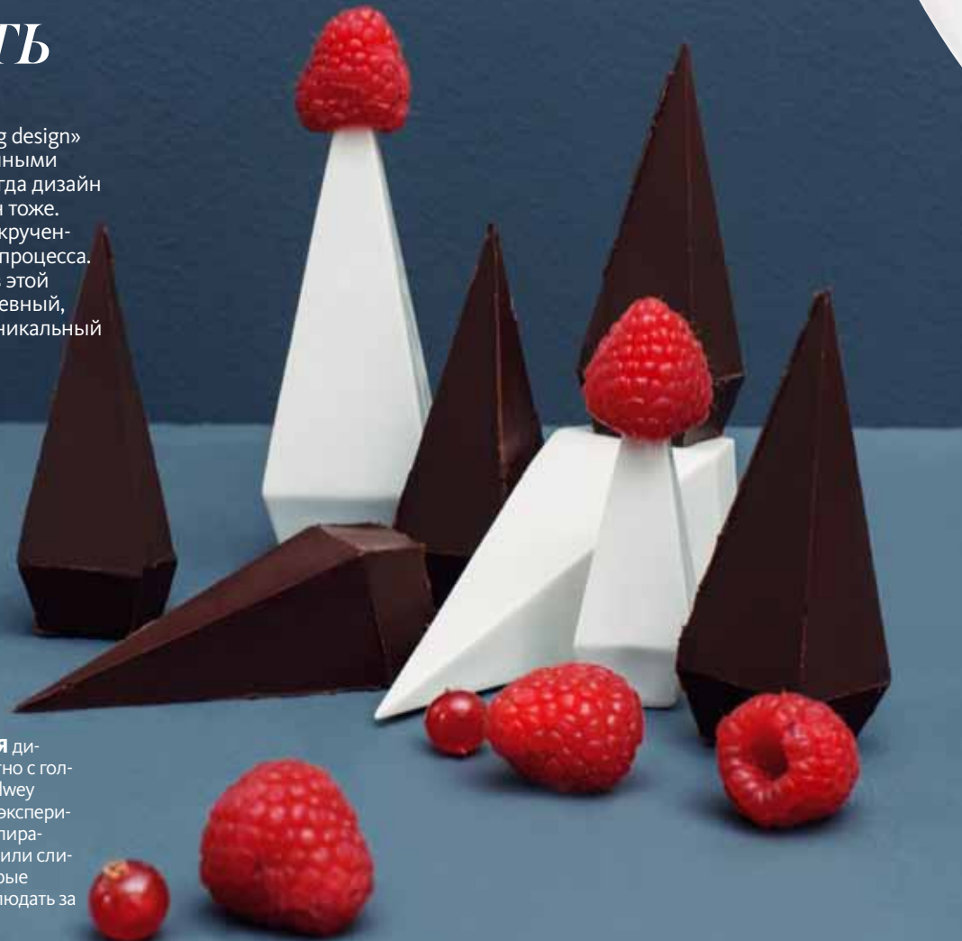
фото: collaboration by Studio Lenneke Wispelwey & Studio Appétit/Photography Masha Bakker Matijevic (1)

ИЗРАИЛЬСКО-АМЕРИКАНСКАЯ дизайн-студия Studio Appétit совместно с голландцами из Studio Lenneke Wispelwey предлагают превратить фуршет в эксперимент. Провокационные приборы-пирамидки позволяют еду накалывать или слизывать, а маленькие зеркала, которые входят в коллекцию, — еще и наблюдать за процессом.