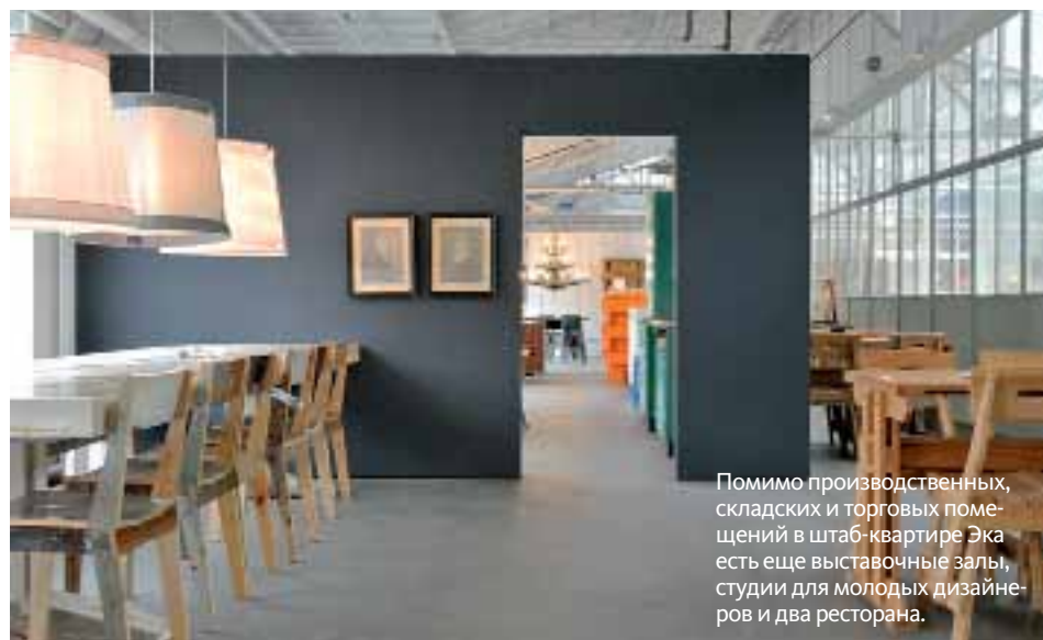
Помимо производственных, складских и торговых помещений в штаб-квартире Эка есть еще выставочные залы, студии для молодых дизайнеров и два ресторана.