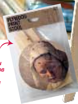
Табуретки Plywood Print с фрагментами живописных шедевров из амстердамского Рейксмузеум, дизайн Пета Хайн Эка для NLXL LAB.