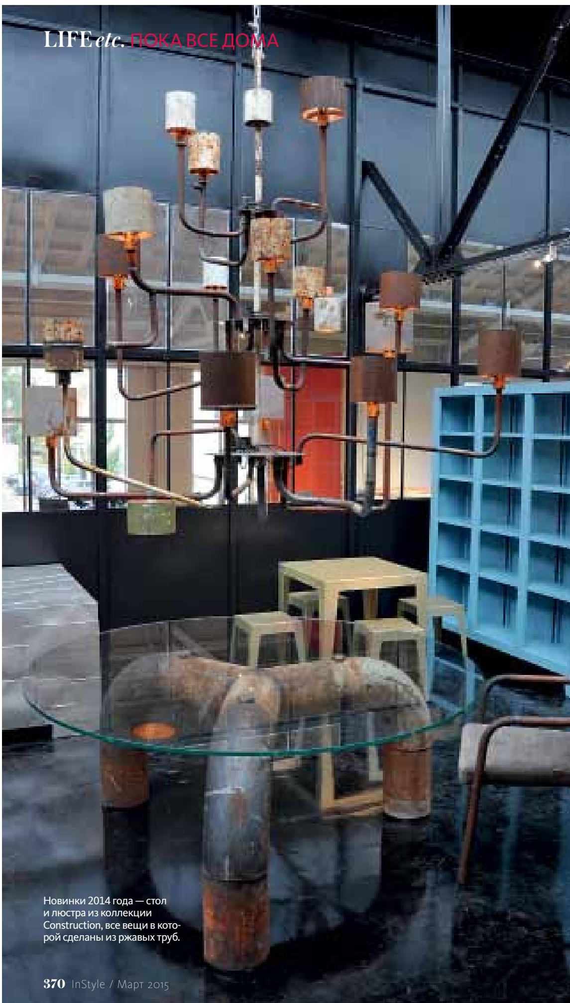
Новинки 2014 года — стол и люстра из коллекции Construction, все вещи в которой сделаны из ржавых труб.