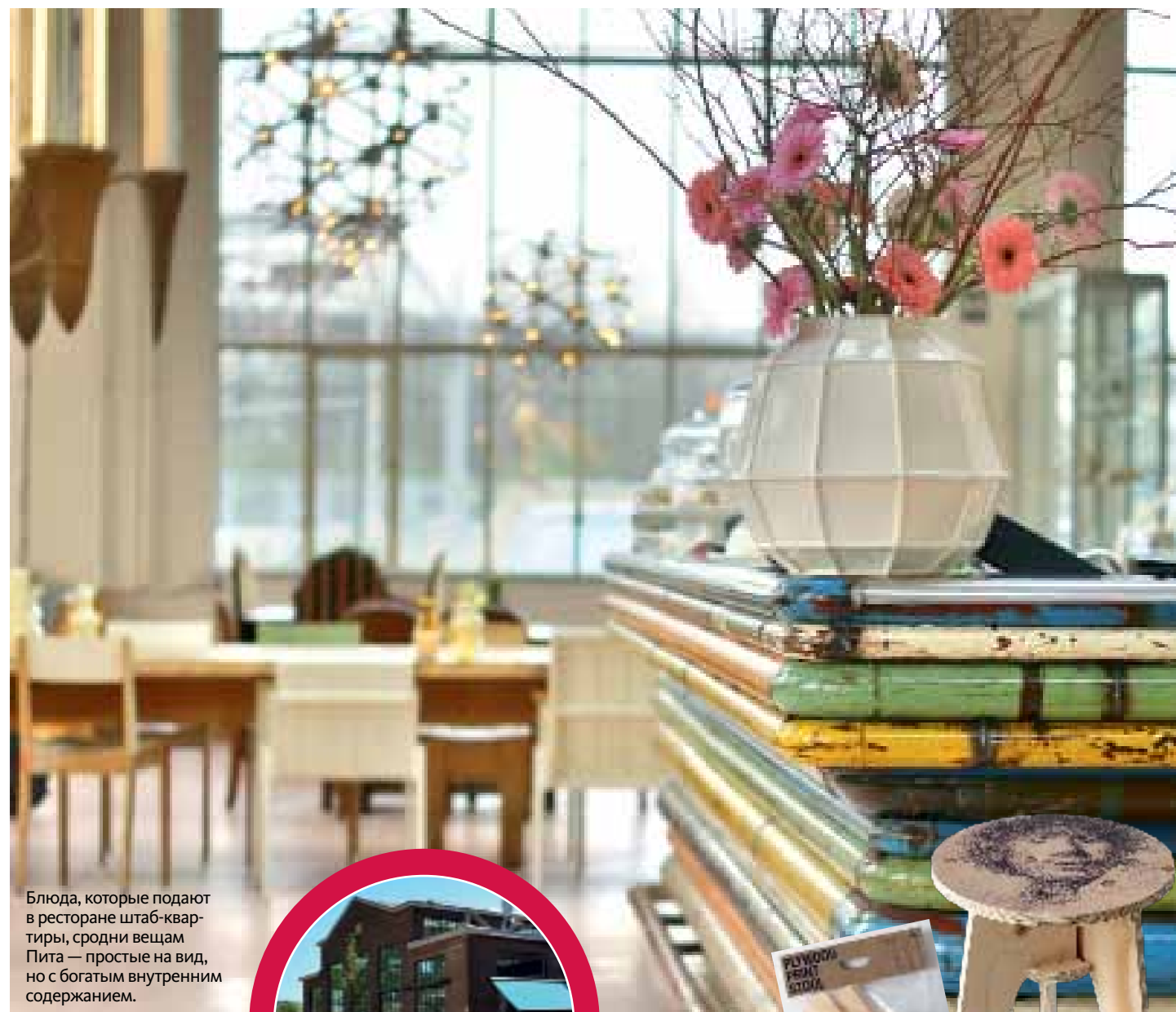
Блюда, которые подают в ресторане штаб-квартиры, сродни вещам Пита — простые на вид, но с богатым внутренним содержанием.