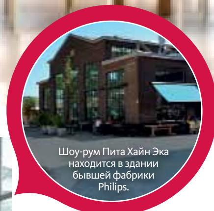
Шоу-рум Пета Хайн Эка находится в здании бывшей фабрики Philips.