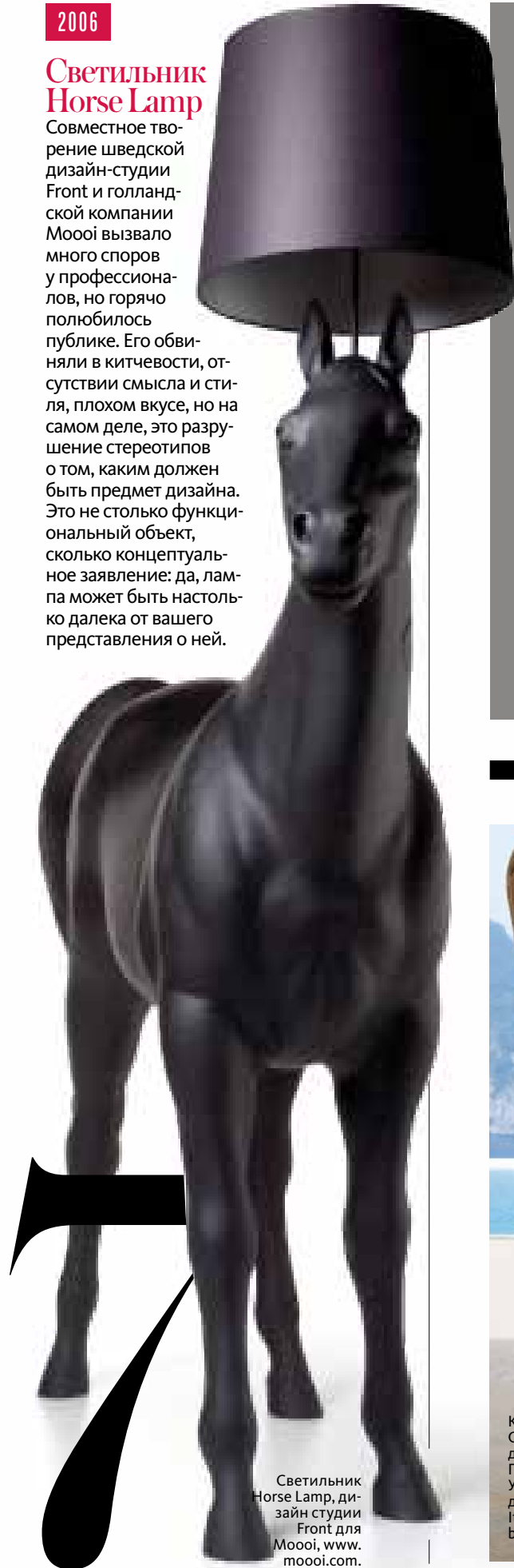
Светильник Horse Lamp, дизайн студии Front для Moooi, www.moooi.com.

Совместное творение шведской дизайн-студии Front и голландской компании Moooi вызвало много споров у профессионалов, но горячо любилось публике. Его обвиняли в китчевости, отсутствии смысла и стиля, плохом вкусе, но на самом деле, это разрушение стереотипов о том, каким должен быть предмет дизайна. Это не столько функциональный объект, сколько концептуальное заявление: да, лампа может быть настолько далека от вашего представления о ней.