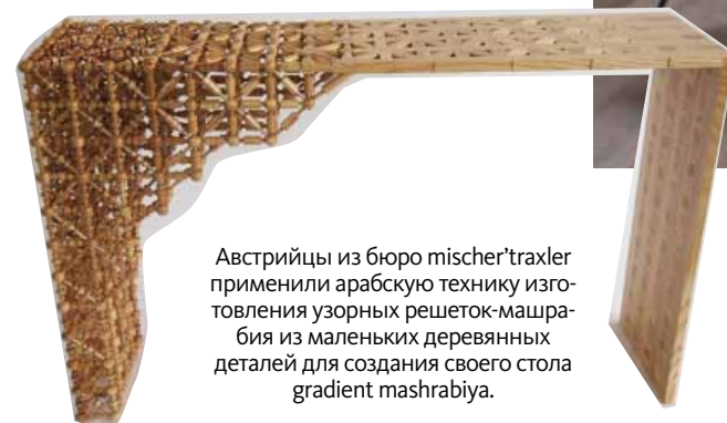
Австрийки из бюро mischer+traxler применили арабскую технику изготовления узорных решеток-машраби из маленьких деревянных деталей для создания своего стола gradient mashrabiya.

Изначально дизайн был лишь разработкой моделей для промышленного производства, однако в последние годы все большие обороты набирает крафтинг: дизайнеры делают серийные вещи вручную — плетут, режут, точат, а также с удовольствием используют старинные ремесленные техники для создания новых современных предметов.