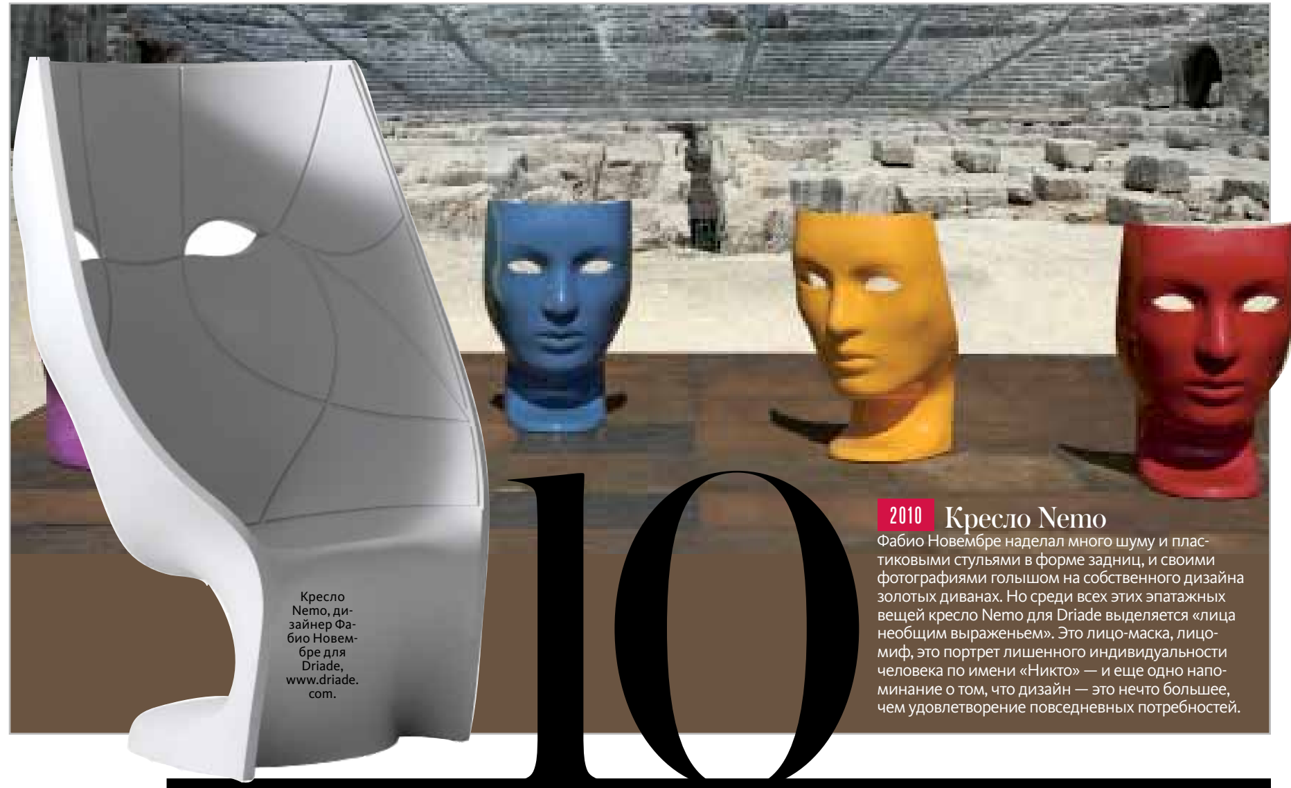
Кресло Nemo, дизайнер Фабио Новембре для Driade, www.driade.com.