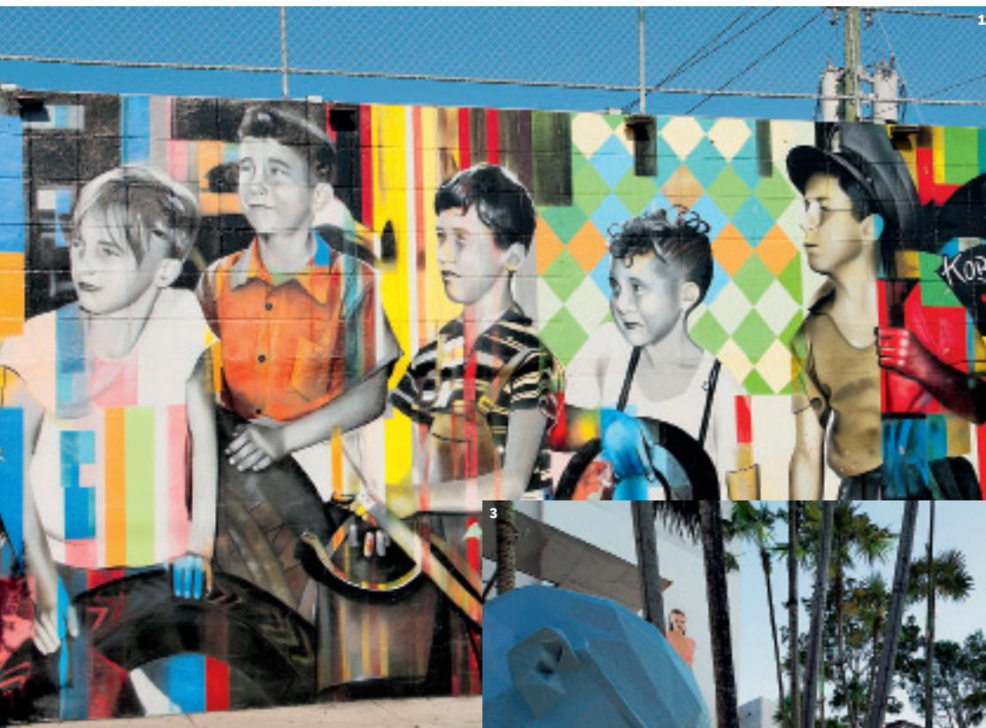
1. РАБОТА СТРИТ-АРТ-ХУДОЖНИКА КОВРА В РАЙОНЕ ИСКУССТВ УИНВУД РЯДОМ С МАЙАМИ.