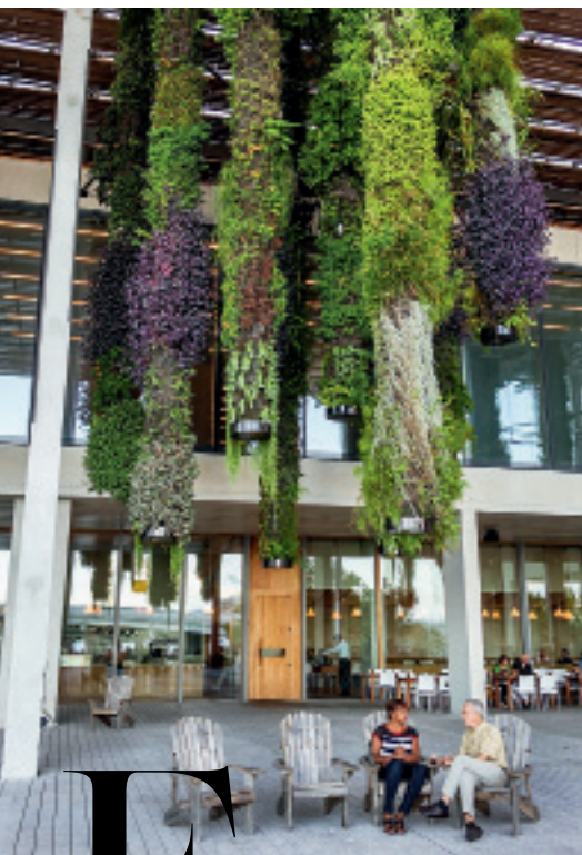
МУЗЕЙ ИСКУССТВ ИМЕНИ ХОРХЕ ПЕРЕСА РАСПОЛОЖЕН НА БЕРЕГУ ОКЕАНА И ЯВЛЯЕТСЯ ЧАСТЬЮ МУЗЕЙНОГО ПАРКА.

Раньше в Майами ездили в декабре — за теплом и современным искусством. Теперь там есть что делать круглый год.