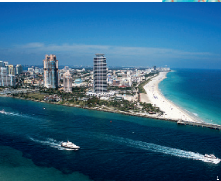
1. ОТ ДАУНТАУНА МАЙАМИ КУРОРТНЫЙ САУС-БИЧ ОТДЕЛЯЕТ БИСКАЙСКИЙ ЗАЛИВ. 2. БУДКИ СПАСАТЕЛЕЙ В СТИЛЕ АР-ДЕКО – ОДИН ИЗ САМЫХ ИЗВЕСТНЫХ СИМВОЛОВ МАЙАМИ.