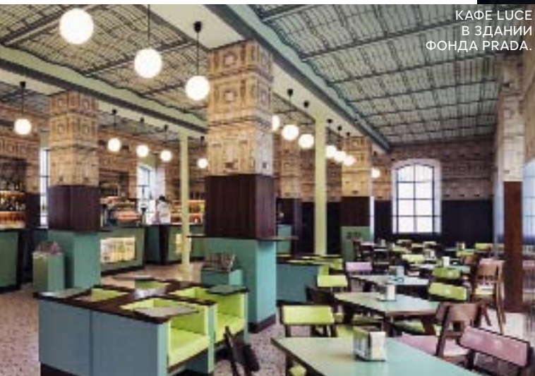
КАФЕ LUCE В ЗДАНИИ ФОНДА PRADA.