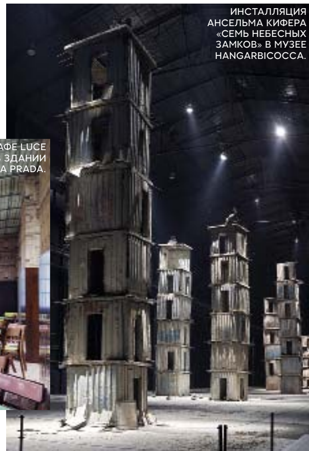
ИНСТАЛЛЯЦИЯ АНСЕЛЬМА КИФЕРА «СЕМЬ НЕБЕСНЫХ ЗАМКОВ» В МУЗЕЕ HANGARBICOCCA.