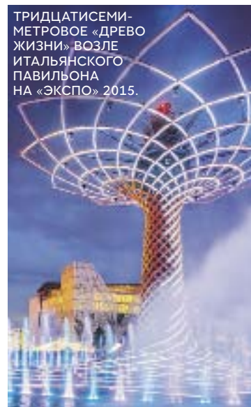
ТРИДЦАТИСЕМИ-МЕТРОВОЕ «ДРЕВО ЖИЗНИ» ВОЗЛЕ ИТАЛЬЯНСКОГО ПАВИЛЬОНА НА «ЭКСПО» 2015.

Идеальный повод взглянуть на Милан по-новому — Всемирная выставка «Экспо», которая будет идти до конца октября. Ехать нужно именно сейчас, когда жара и первый вал посе-