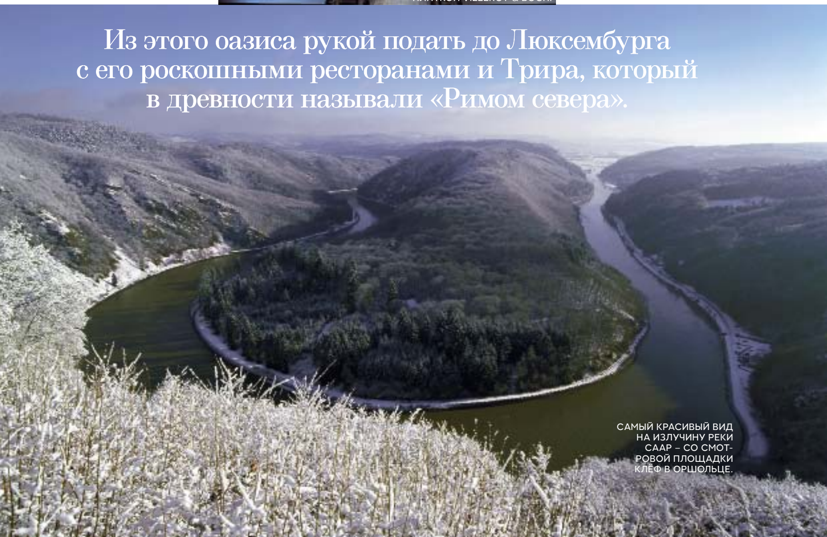
САМЫЙ КРАСИВЫЙ ВИД НА ИЗЛУЧИНУ РЕКИ СААР — СО СМОТРОВОЙ ПЛОЩАДКИ КЛЕФ В ОРШОЛЬЦЕ.

Из этого оазиса рукой подать до Люксембурга с его роскошными ресторанами и Трира, который в древности называли «Римом севера».