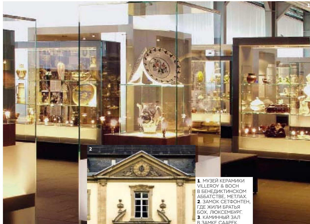
1. МУЗЕЙ КЕРАМИКИ VILLEROY & BOCH В БЕНЕДИКТИНСКОМ АББАТСТВЕ, МЕТЛАХ. 2. ЗАМОК СЕТФОНТЕН, ГДЕ ЖИЛИ БРАТЬЯ БОХ, ЛЮКСЕМБУРГ. 3. КАМИННЫЙ ЗАЛ В ЗАМКЕ СААРЕК.

Отдельно номер снять, увы, нельзя, но можно арендовать целиком особняк для торжества в духе «Аббатства Даунтон». Во всех двадцати двух спальнях — старинные резные гардеробы, скрипучие дубовые полы и отделанные по последнему слову техники и моды ванны, нигде не повторяющиеся ни планировкой, ни набором сантехники, ни плиткой. Конечно, Villeroy & Boch с таким «выставочным залом» никаких шоу-румов не надо — гости, раз переночевав, больше думать не могут ни о чем, кроме роскоши ванных комнат.