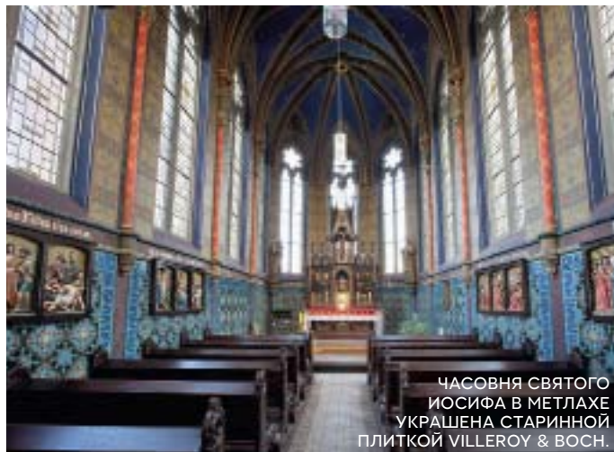
ЧАСОВНЯ СЯГО ИОСИФА В МЕТЛАХЕ УКРАШЕНА СТАРИННОЙ ПЛИТКОЙ VILLEROY & BOCH.

С Мишелем фон Бохом мы беседуем в особняке Саарек, который когда-то его прадедушка построил