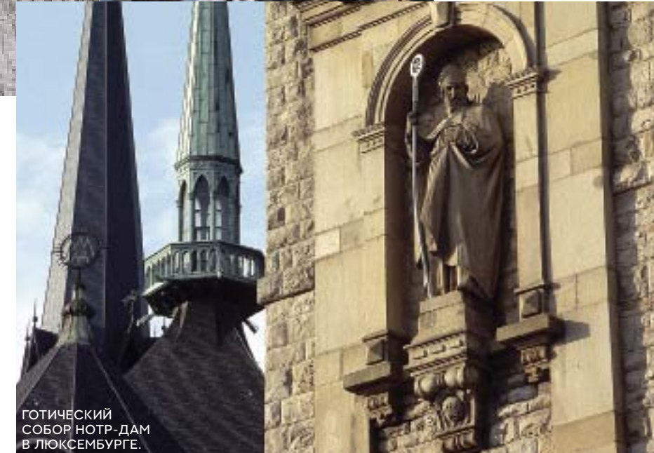
ГОТИЧЕСКИЙ СОБОР НОТР-ДАМ В ЛЮКСЕМБУРГЕ.