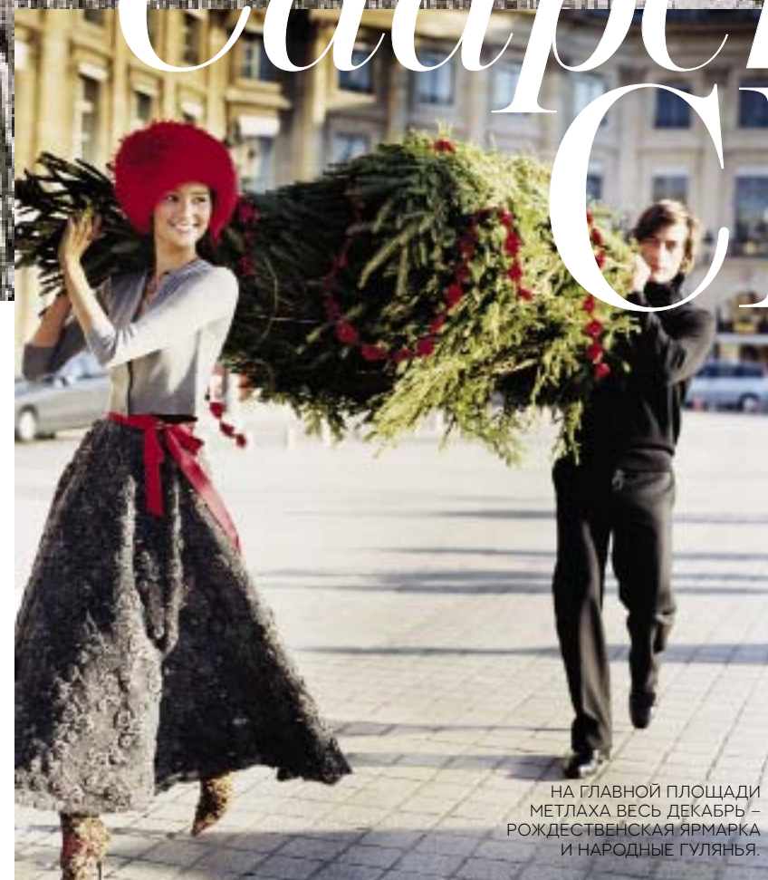
НА ГЛАВНОЙ ПЛОЩАДИ МЕТЛАХА ВСЬ ДЕКАБРЬ — РОЖДЕСТВЕНСКАЯ ЯРМАРКА И НАРОДНЫЕ ГУЛЯНЬЯ.

Чтобы ощутить дух Рождества, езжайте в Метлах, родину плитки и самого знаменитого фарфора в мире. Там сохранилась вся прелесть старой Европы!