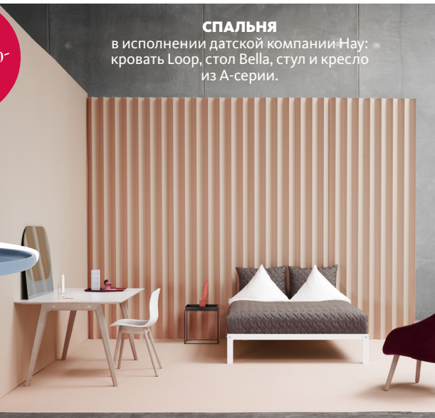
СПАЛЬНЯ в исполнении датской компании Нау: кровать Loop, стол Bella, стул и кресло из A-серии.