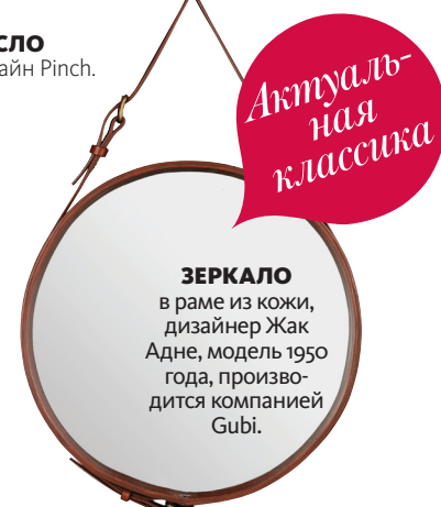
ЗЕРКАЛО в раме из кожи, дизайнер Жак Адне, модель 1950 года, производится компанией Gubi.