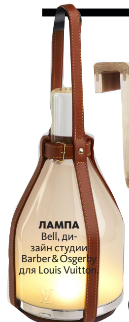
ЛАМПА Bell, дизайн студии Barber & Osgerby для Louis Vuitton.