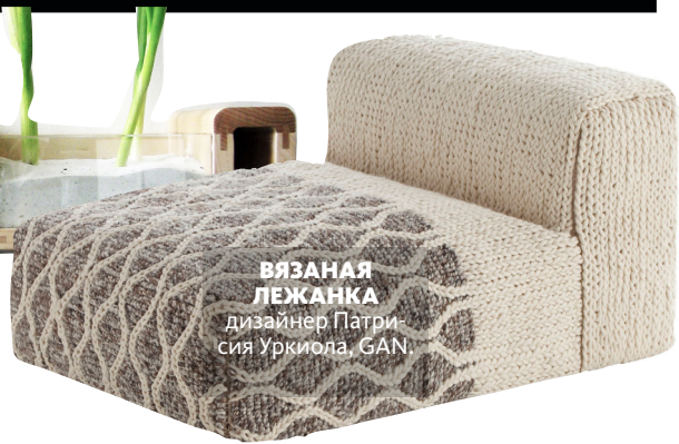
ВЯЗАНАЯ ЛЕЖАНКА дизайнер Патриция Уркиола, GAN.

О «простой жизни» на природе мечтают многие жители мегаполисов. Но это все-таки рай не в шалаше, а со всеми удобствами и в привычной современной эстетике: даже грабли, лопаты, уличный умывальник и переносной фонарь на ремне удостоились внимания дизайнеров. Многие предметы сделаны вручную или выглядят таковыми, как вязаные лежанки компании GAN. Другие маскируются под старые — например, мебель из досок под маркой Secondome. Третьи — возвращают в наш дом привычки «старины глубокой», когда вместо холодильников был ледник, а морковку хранили в песке.