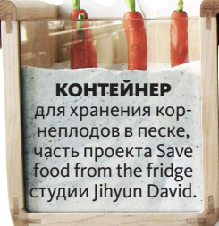
КОНТЕЙНЕР для хранения корнеплодов в песке, часть проекта Save food from the fridge студии Jihyun David.