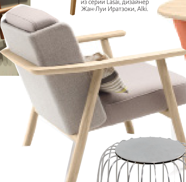
КРЕСЛО из серии Lasai, дизайнер Жан-Луи Иратзоки, Alki.