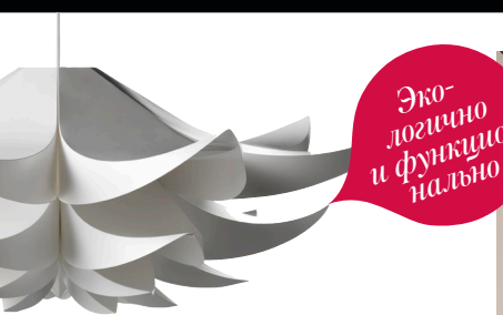
АБАЖУР ДЛЯ ЛАМПЫ Norm об, дизайнер Симон Карков, Normann Copenhagen.

Скандинавский стиль представить легко: лаконичные вещи из светлого дерева, комфортные и телу, и глазу. Но главное в дизайне все-таки не внешность, а идеология: простота, скромность, честность, экологичность. В северных странах все это уже лет сорок не выходит из моды, а остальную Европу подумать об экономии и «о душе» заставил кризис. Датчане спешат на помощь: Нау и Normann Copenhagen привезли в Париж полный набор для ответственного потребителя — от вантузов до диванов и гардеробных.