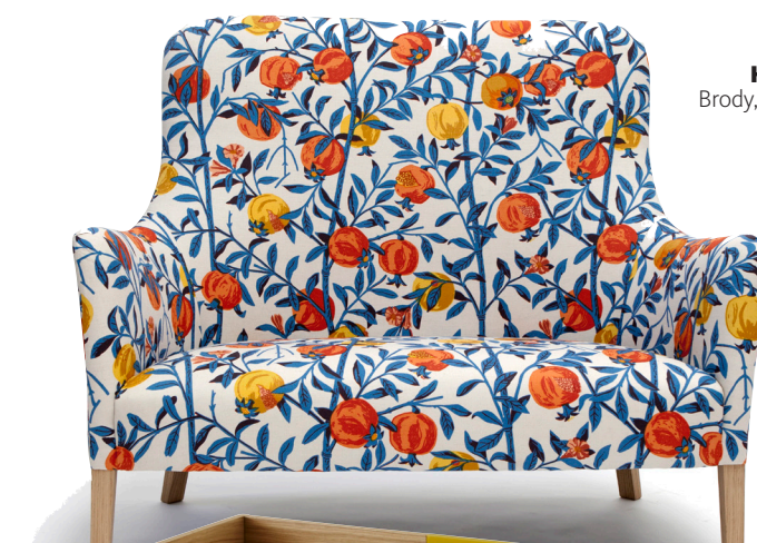
КРЕСЛО Brody, дизайн Pinch.