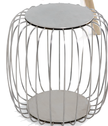
ПУФ Pumpkin, дизайн студии Autoban, De La Espada.