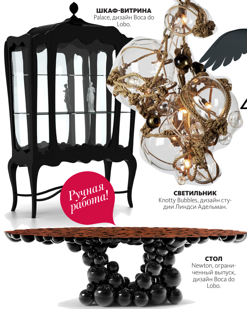
ШКАФ-ВИТРИНА Palace, дизайн Boca do Lobo.