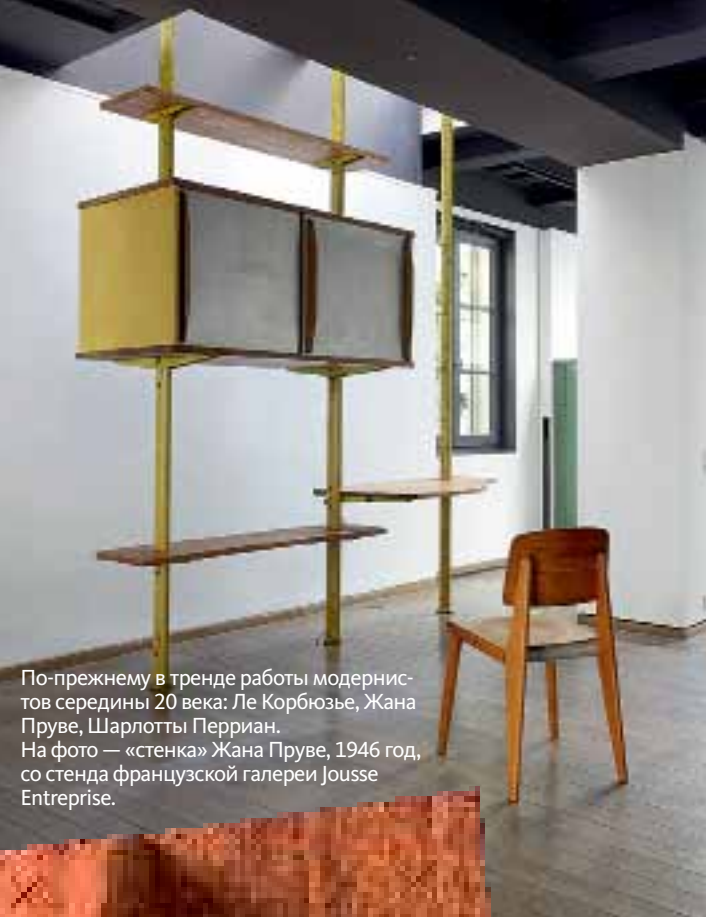
По-прежнему в тренде работы модернистов середины 20 века: Ле Корбюзье, Жана Пруве, Шарлотты Перриан. На фото — «стенка» Жана Пруве, 1946 год, со стенда французской галереи Jousse Entreprise.