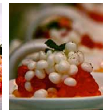
Лососевая икра с икрой из яичного белка и желтка.