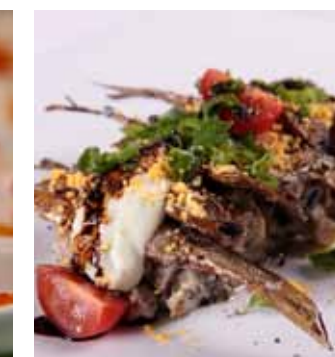
Шпроты на подушке из баклажанов и черного хлеба.