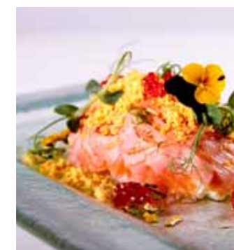
Так выглядит салат «Мимоза» в ресторане «Чайка».