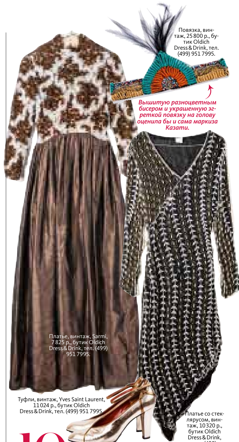
Повязка, винтаж, 25 800 р., бутик Oldich Dress & Drink, тел. (499) 951 7995.

Хотелось бы вам встретить Новый год в каком-то необычном месте? Знаете, я встречала Новый год в Париже, в Индии, да много где еще... Но на самом деле, главное — не где ты его встречаешь, а с кем. Хочу, чтобы каждый праздник меня окружали мои любимые и дорогие, а уж где это будет — не имеет значения.