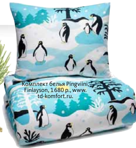
Комплект белья Pingviini, Finlayson, 1 680 р., www.td-komfort.ru.