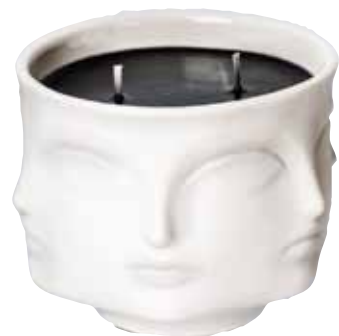
Свеча Muse Noir, Jonathan Adler, 5 300 р., www.luxurycandles.ru.

Тут важно камерное, приглушенное освещение. Хорошо бы зажечь на балконе и над кроватью в спальне старые добрые фонарики, а для елки не поленилась разыскать на блошиных рынках специальные подсвечники на прищепках, еще советские: с ними пожар исключен, а никакие лампочные гирлянды со свечками на елке не сравнятся.