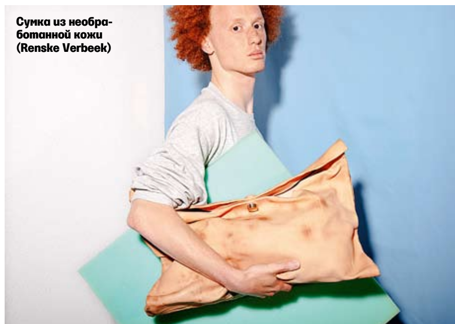
Сумка из необработанной кожи (Renske Verbeek)