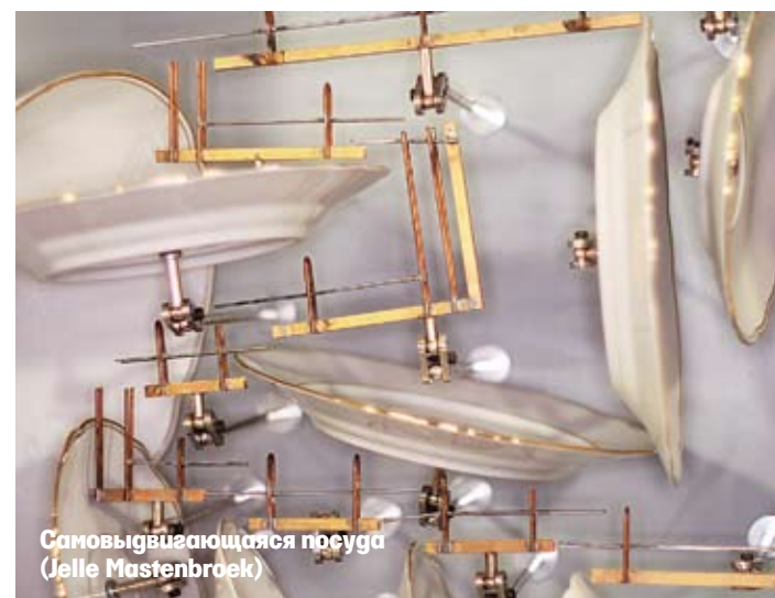
Самовывдвигающаяся посуда (Jelle Mastenbroek)