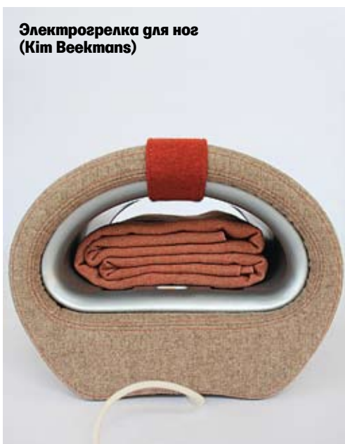
Электрогрелка для ног (Kim Beekmans)