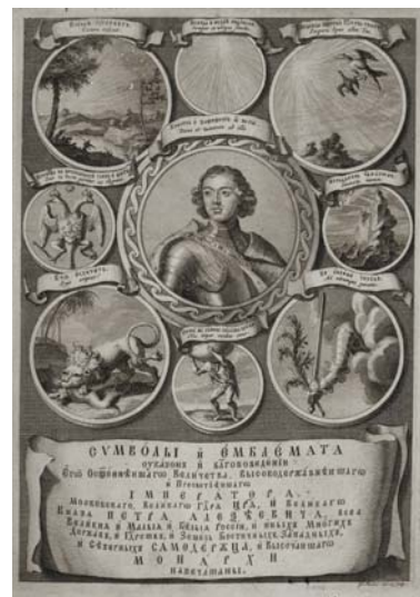
«Символы и Эмблематы». Фронтиспис с гравированным портретом Петра I. 1705.

С 5 ноября Выставочный зал центра искусств «Волконка Гранд» На Волхонке, 15, пройдет выставка аукционного дома «Антиквариум», где покажут коллекцию редких и ценных книг, многие из которых являются настоящими «объектом вожделения» для нескольких поколений библиофилов.