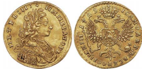
Золотой рубль Петра II. 1728 г.

Ноябрьские нумизматические торги открывают «Редкие монеты». Свой второй аукцион под названием «Коллекционные русские монеты» он проведет 9 ноября. Заявлено 489 лотов монет, 28 лотов нумизматической литературы и 5 мюнцкабинетов. Оправдывая свое название, аукционный дом из 489 лотов монет дает 296 лотов состояния Uncirculated и 33 лота особой коллекционной сохранности PROOF. Впервые выставляется так много монет в слабах – 126 лотов. Стартовые цены на 25 лотов превышают 10 тыс. долл. Среди них две медные монеты. Это четверть копейки 1870 года СПб (10 тыс. долл.) и пробные 3 копейки 1827 года (11,5 тыс. долл.). Максимальные 85 тыс. долл. имеет старт червонец Петра II 1729 года. На николаевский рубль 1913 года в сохранности PROOF 68 и редкую александровскую золотую десятку 1890 года торги начнутся с 50 тыс. долл. Много золотых монет XVIII–XX веков в высоком коллекционном состоянии – 77 лотов. Среди них следует особо выделить 10 рублей 1762 года ММД Екатерины II – перекан из 10 рублей Петра III со стартом в 30 тыс. долл. Несколько монет с великолепным провенансом – они из коллекций известных западных нумизматов.