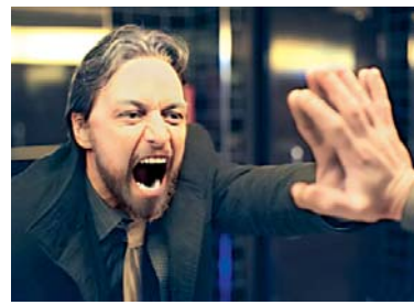
Герой Джеймса МакЭвоя – извращенец, наркоман и по совместительству еще и полицейский. Кадр из фильма «Грязь»

Фестиваль «Новое британское кино» представляет зрителям подборку самых значимых фильмов, снятых в Соединенном Королевстве за последний год. Фестиваль откроется картиной Оливера Хиршбиля «Диана. История любви» с Наомией Уоттс в главной роли. Также в программе фильмы «Повседневность» Майкла Уинтерботта, «Грязь» по роману шотландского писателя Ирвина Уэлша с Джеймсом МакЭвсом в главной роли, новая работа Бена Уитли «Поле в Англии», «Двойник» Ричарда Айади, смелая экранизация Достоевского в декорациях современного Лондона, и другие картины, включая специальную программу короткометражного кино.