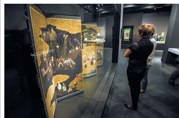
Европейские живописцы и графики вдохновлялись необычными росписями японских ширм.

Связь восточной и западной культур также можно проследить и на международном танцевальном фестивале «Мадрид в танце». Один из главных акцентов в его программе будет сделан именно на танце Востока. Ведущие хореографы покажут зрителям эволюцию танца – его современное развитие и связь с западными танцевальными направлениями. Но не стоит торопиться домой, в Мадриде стоит остаться еще на несколько дней: лучшие танцевальные ансамбли со всего мира приедут сюда уже после законных российских праздников, с 5 по 24 ноября. Однако в стране, одним из символов которой является фламенко, танец ценится не меньше классических видов искусства и заслуживает того, чтобы продлить отдых в Испании.