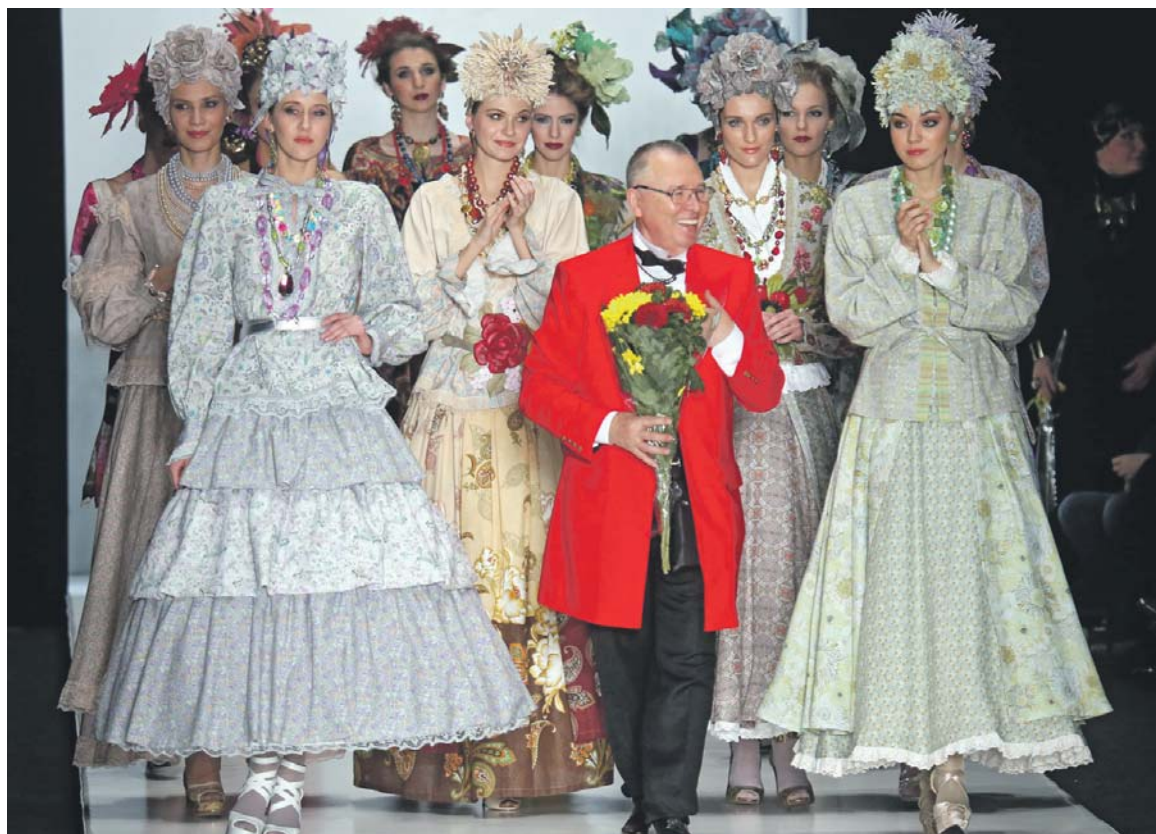
Вячеслав Зайцев господствовал на Mercedes-Benz Fashion Week.

Важным событием стали проведенные при поддержке Министрства промышленности и торговли РФ показы дизайнеров, решившихся на сотрудничество с фабриками. Помимо упомянутого выше Вячеслава Зайцева бренд «Алена Ахмадулина» создал коллекцию домашнего текстиля для объединения «Монолит», выступающего под торговой