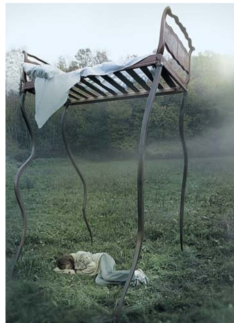
Умберто Даттола превратил обычную мебель в гигантские фантазийные творения.