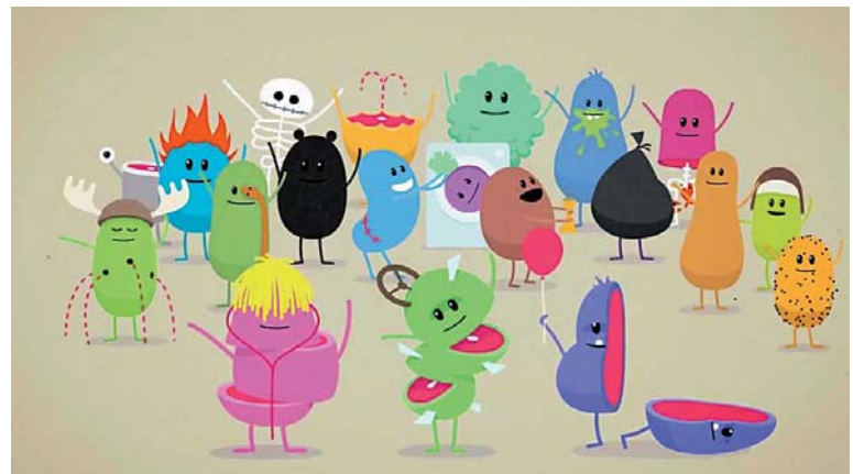
Гран-при получил показавшийся на первый взгляд примитивным ролик австралийского метро «Как глупо можно умереть».

И вообще настроение катастрофически ухудшалось. Непонятно – что за публика пришла на все-таки относительно элитарное зрелище «Каннских львов»? Российские рекламщики? Пиарщики? Двери в зал – нарастающая паника, народ фланирует туда-сюда с завидным постоянством. Я человек в подобных ситуациях невыдержанный и, когда по моим ногам в очередной раз прошлись, завывала: «Вообще-то идет мероприятие... Что за уродов нагнали в Дом кино?» Из-за этого