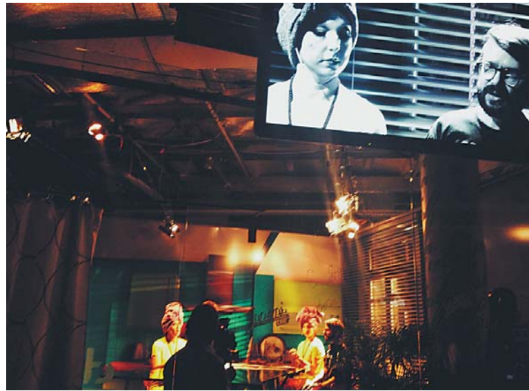
«Мила» со зрительских мест: в глубине актеры играют как в театре, на плазме – крупный план действия.

«Дождь» – воистину канал, постоянно экспериментирующий в эфире. В чем зрители убедятся 3 ноября, увидев на экране телеспектакль? теледрамасинтез? телеэксперимент? под названием «Мила». Мы, 50 зрителей этого действия в вечерней темной студии «Дождя», в этом уже убедились. Нас предупредили, что «Мила» – новый театральный проект творческого объединения Le Cirque de Charles La Tannes (объединение актеров, режиссеров, музыкантов и художников, независимая творческая группа. Образована в 2006 году выпускниками школы-студии МХАТ. «Точка нашего внимания – манифестация современных форм театральной активности. Мы создаем по принципу DIY свой театр через поста-