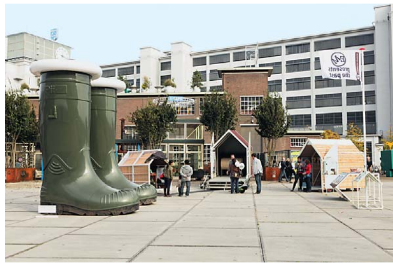
Поеть в уютных кафе и оценить новинки дизайна можно было одновременно.