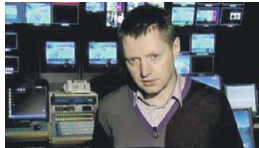
Алексей Пивоваров готов попробовать себя в медиа в новых качествах.