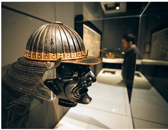
Специально для выставки «Восхищение японским искусством» привезли самурайские доспехи.

Выставка «Веласкес и семья Филиппа IV» открылась в Прадо несколько недель назад и уже успела привлечь внимание как самих испанцев, так и множество туристов, готовых отстоять очередь за заветным билетом. Многочисленная испанская королевская семья предстает во всем богатстве на 30 работах Веласкеса. Один из шедевров Диего Веласкеса — «Менины» — был создан в то же время и наглядно демонстрирует художественные искания художника: отход от канонов реализма, использование жирных мазков, скла-